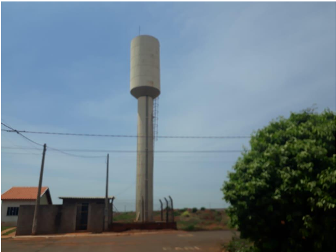
Figura 03 – Demarcação da área para Construção do Novo Reservatório “Coluna Cheia”.

Estância Climática de Campos Novos Paulista, 02 de outubro de 2019.