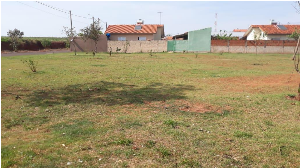
Figura 02 – Demarcação da área para Construção do Novo Reservatório “Coluna Cheia”.

CNPJ 46.787.644/0001-72 – e-mail: pmcampospta@terra.com.br