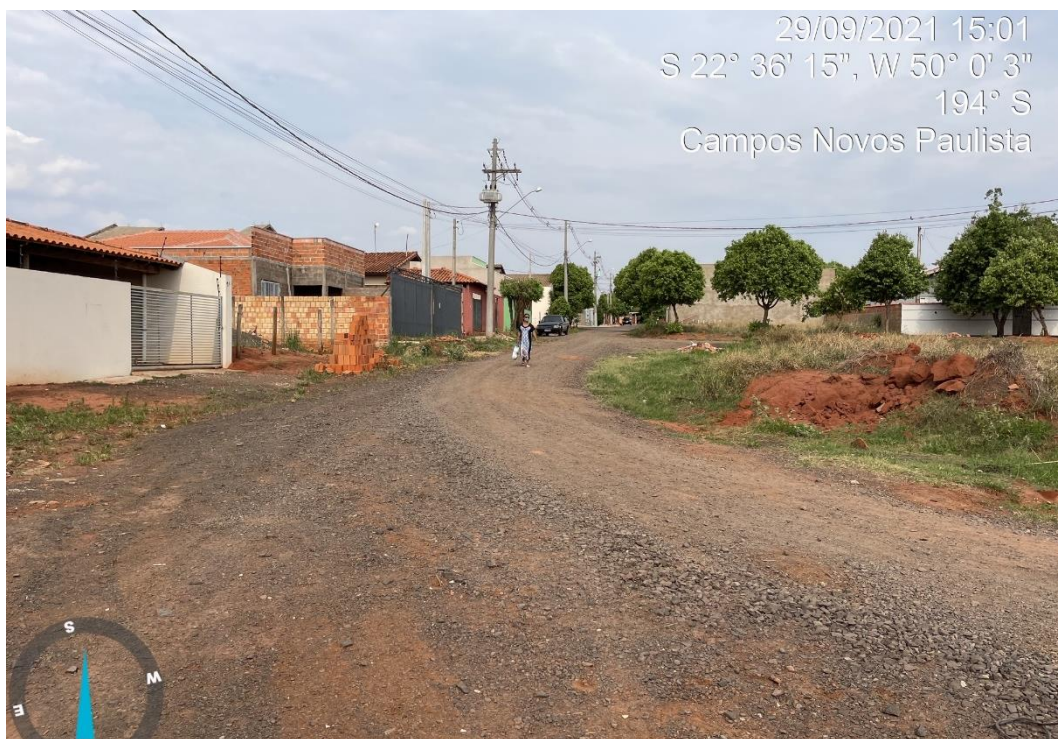
RUA ALAMEDA DAS ROSAS