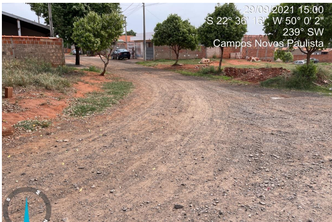
RUA ALAMEDA DOS JASMINS