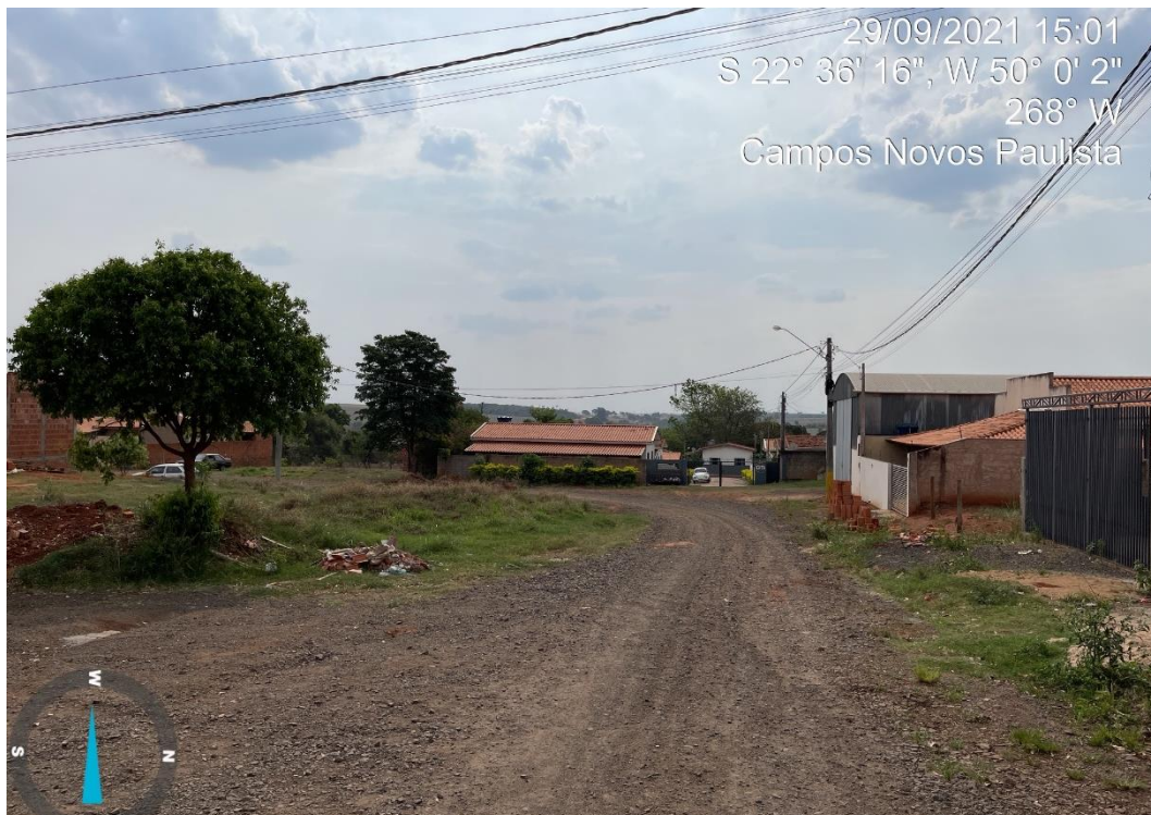
RUA ALAMEDA DAS ROSAS

CNPJ 46.787.644/0001-72 – e-mail: pmcampospta@terra.com.br