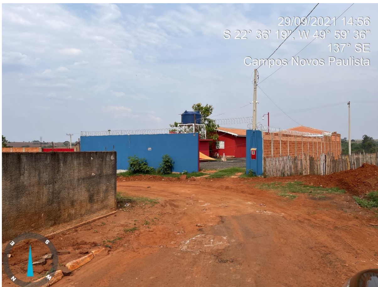
RUA JOÃO ANTÔNIO DE LIMA