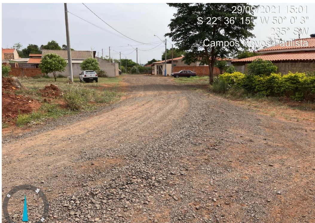
RUA ALAMEDA DOS LÍRIOS

CNPJ 46.787.644/0001-72 – e-mail: pmcampospta@terra.com.br