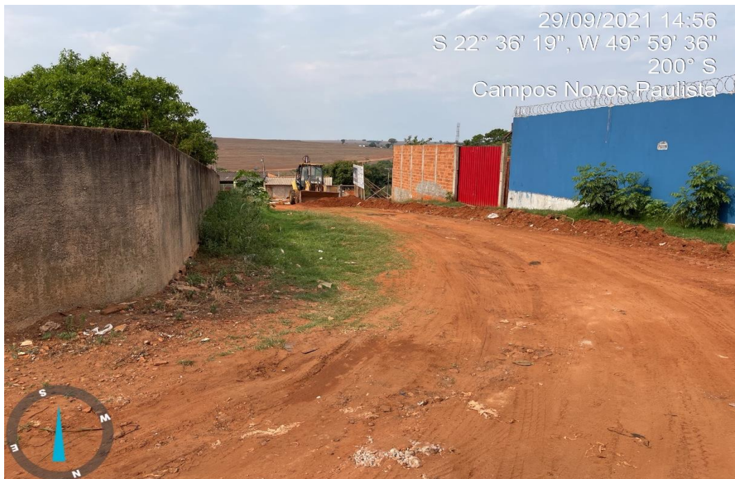
RUA JOÃO ANTÔNIO DE LIMA

CNPJ 46.787.644/0001-72 – e-mail: pmcampospta@terra.com.br